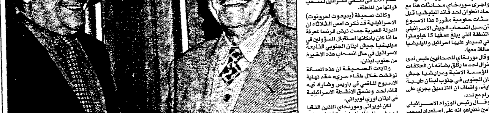
مورخاي لدى لقائه أمس

وقال السفير البريطاني في دمشق ان المفاوضات السورية يجب ان تبني على ما تم انجازه سابقا في حال استئنافها بين الطرفين، وقال ان المفاوضات السورية يجب ان تبني على ما تم انجازه سابقا في حال استئنافها بين الطرفين.